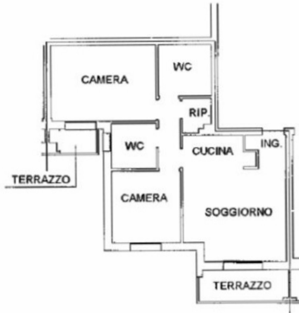
PIANO PRIMO H=270